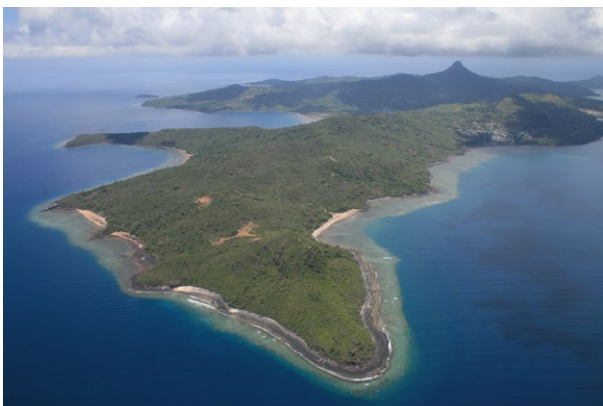
Vue du ciel