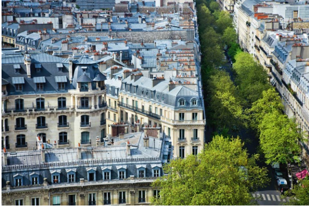
Paris, les Grands Boulevards