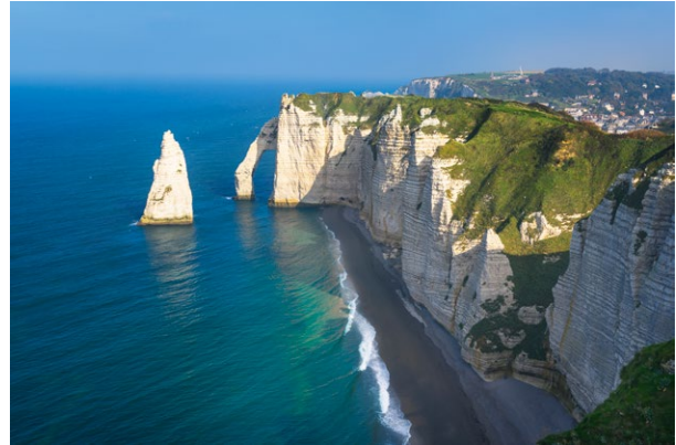
Les falaises d'Étretat