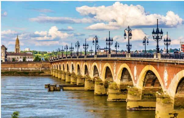
Bordeaux, le pont de Pierre