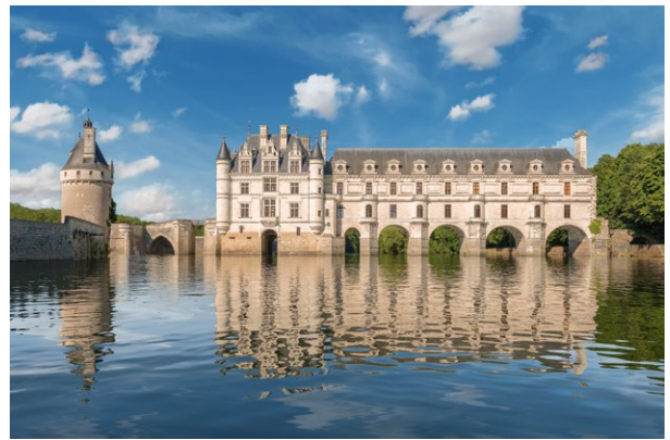
Le château de Chenonceau