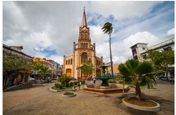
Fort-de-France, la cathédrale Saint-Louis