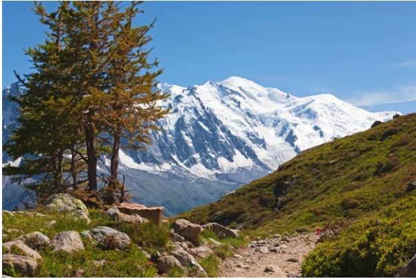
Le massif du Mont-Blanc