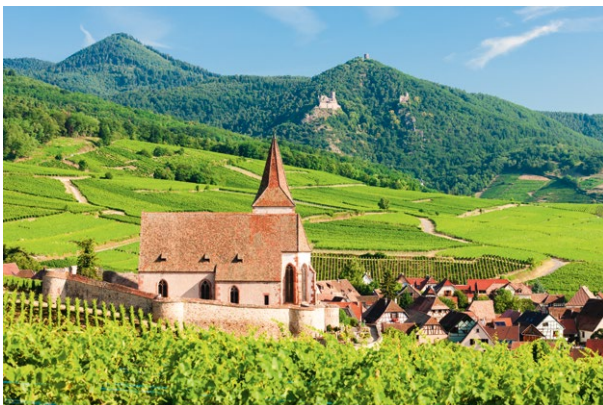
L'Alsace, le village d'Hunawihr