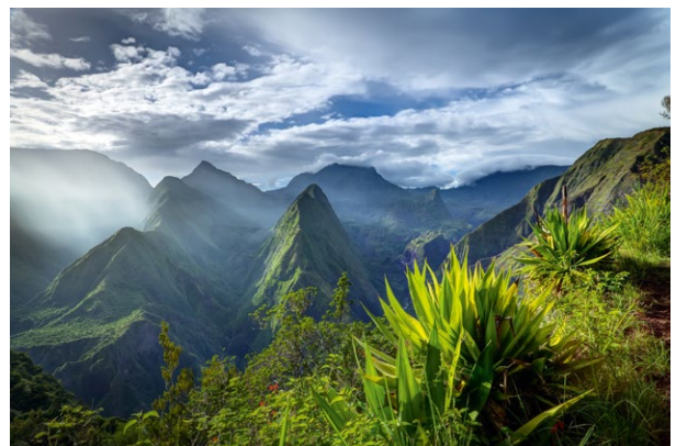
Le cirque de Mafate

Bonifacio; Iles des Saintes; Singe écureuil; Fort-de-France, la cathédrale Saint-Louis; Mayotte; Le cirque de Mafate