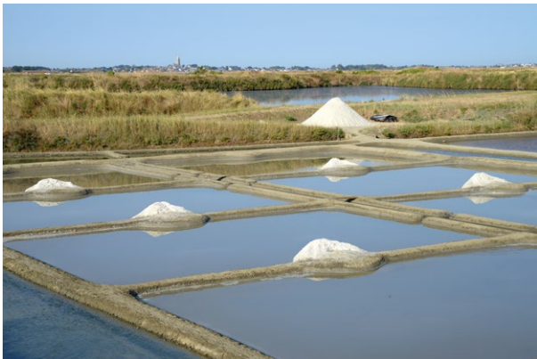
Les salines de Guérande