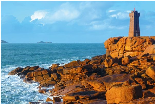
La Côte de Granit rose