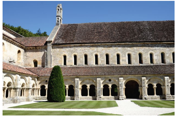
L'abbaye de Fontenay