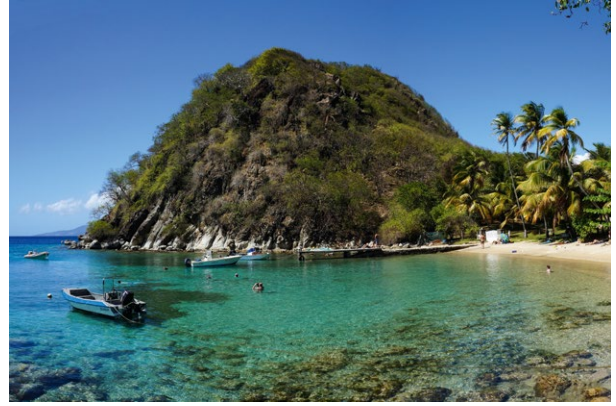
Iles des Saintes