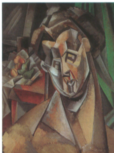
Femme aux poires, de Pablo Picasso, 1909