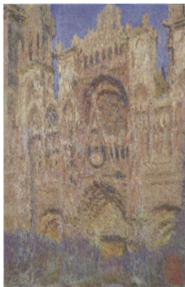
La Cathédrale de Rouen, effet de soleil, fin de journée, de Claude Monet, 1892