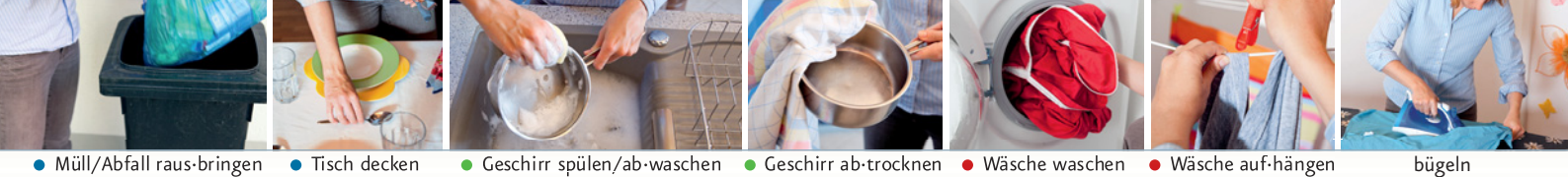
● Müll/Abfall raus-bringen ● Tisch decken ● Geschirr spülen/ab-waschen ● Geschirr ab-trocknen ● Wäsche waschen ● Wäsche auf-hängen ● bügeln