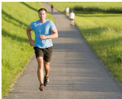
B mehr Sport treiben