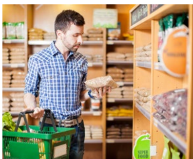
E mehr Bio-Lebensmittel kaufen