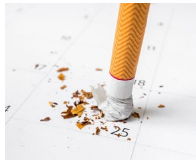
C mit dem Rauchen aufhören