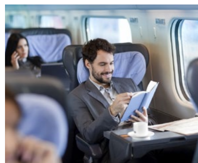
F mehr mit dem Zug fahren statt mit dem Auto

c Haben Sie sich etwas für das neue Jahr vorgenommen? Wenn ja, was? Wenn nein, warum nicht? Erzählen Sie.