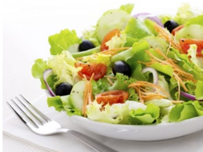
A gesünder essen und abnehmen

b Was sind wohl die drei häufigsten Vorsätze, die Menschen in Deutschland für das neue Jahr fassen? Kreuzen Sie an.