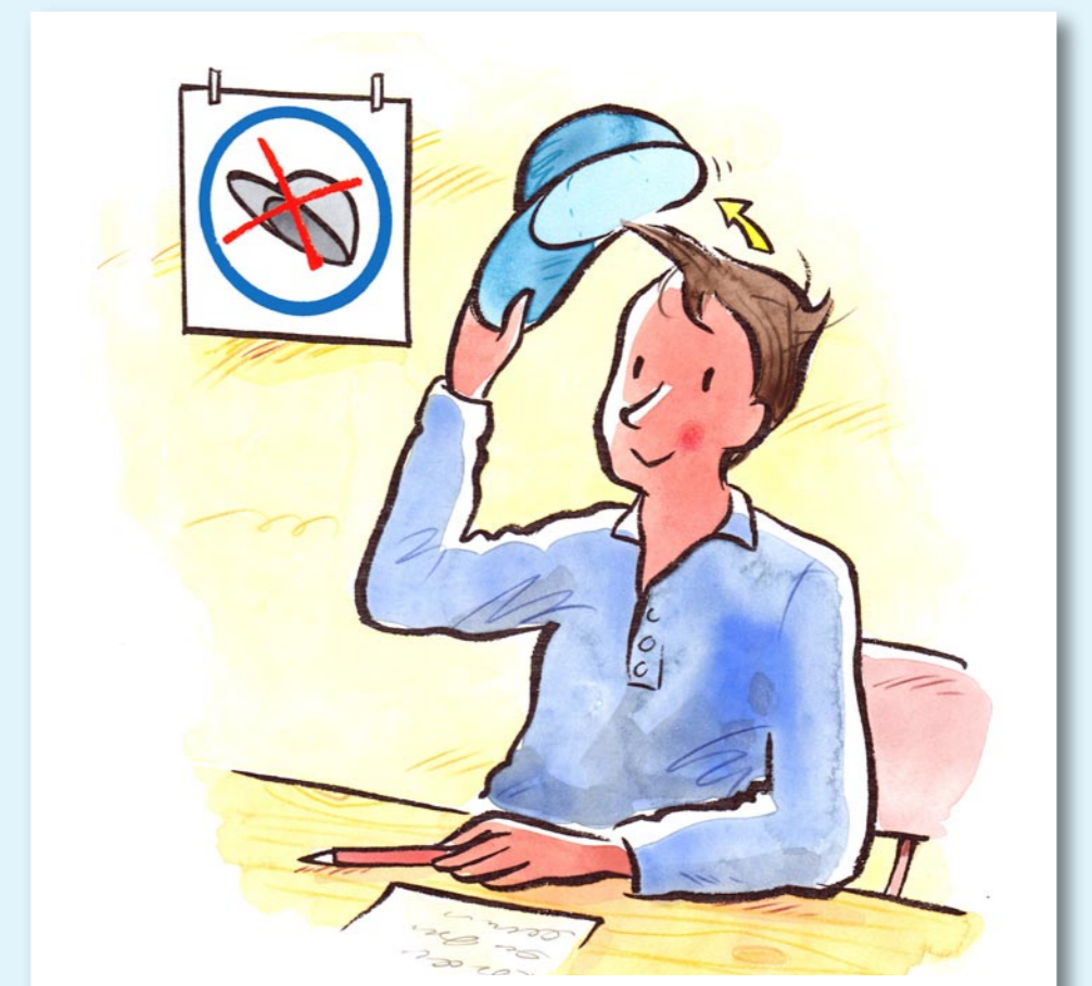
Wir halten uns an die Kursregeln.