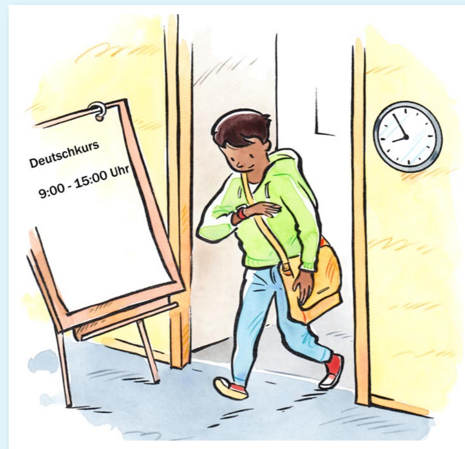
Wir sind pünktlich.