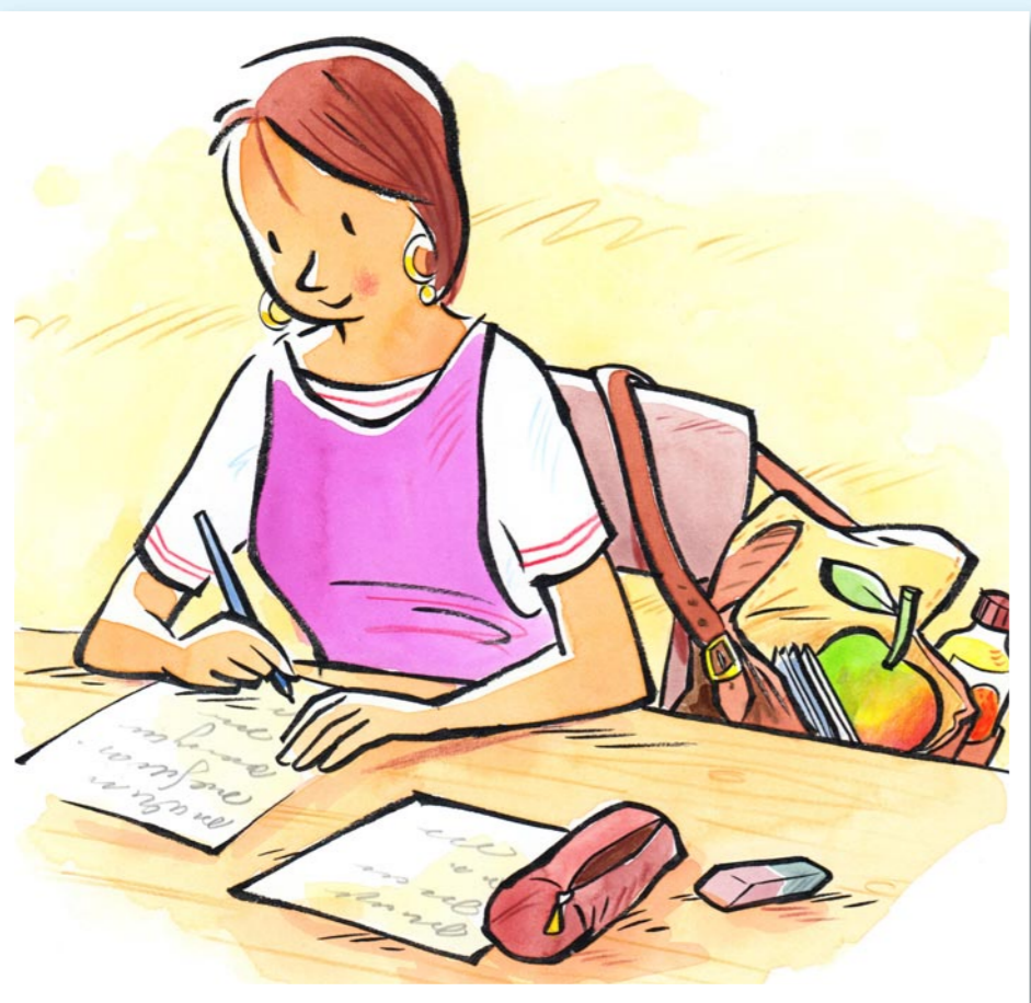
Wir essen nur in der Pause.