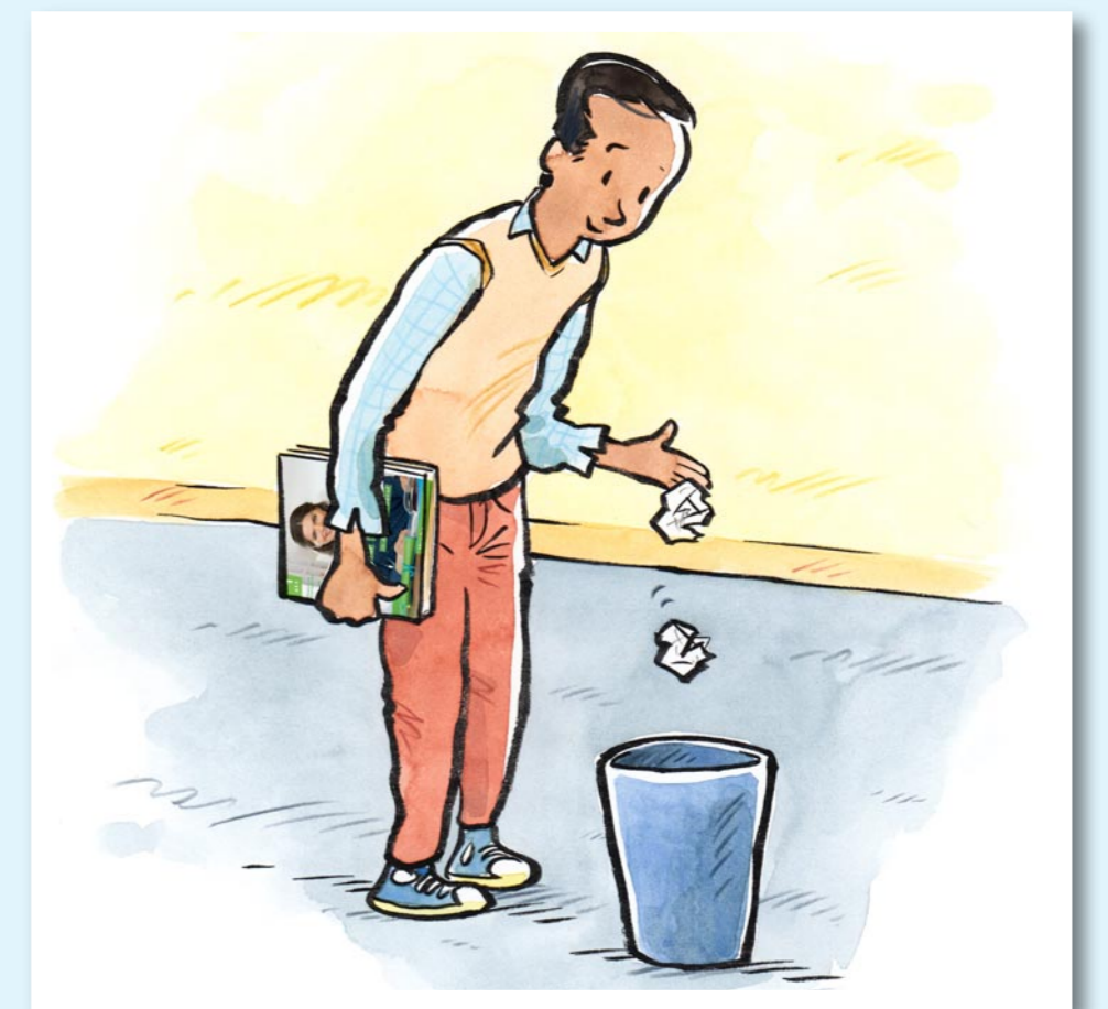
Wir werfen Müll in den Papierkorb.