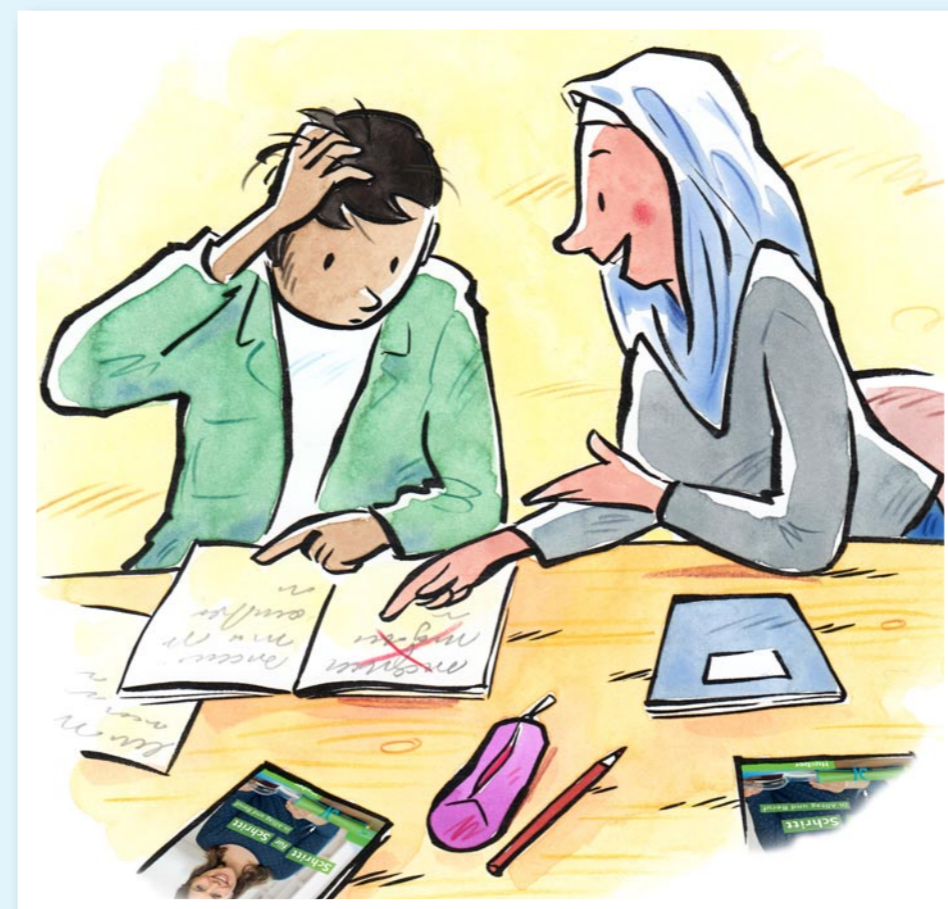
Wir sind höflich und freundlich.