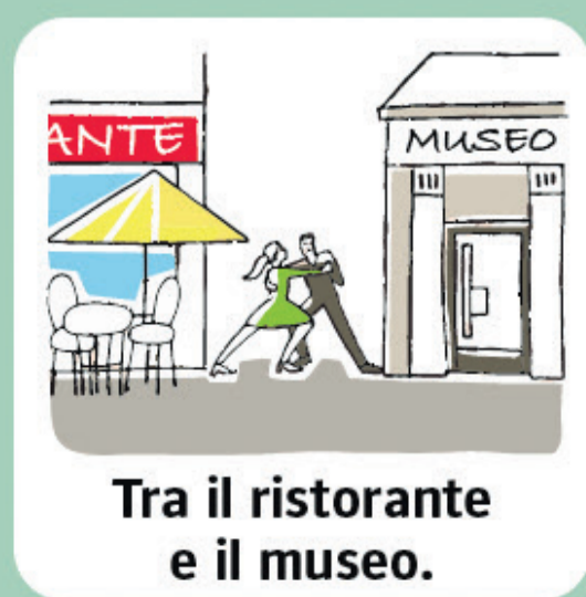
Tra il ristorante e il museo.