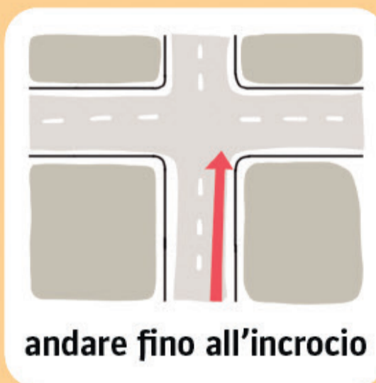
andare fino all'incrocio