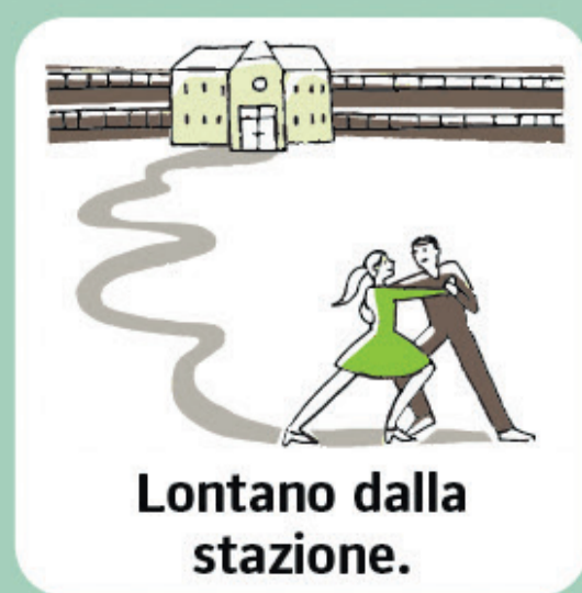
Lontano dalla stazione.