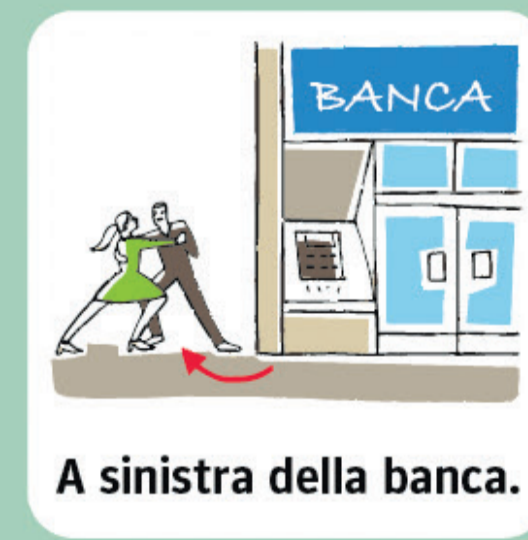
A sinistra della banca.