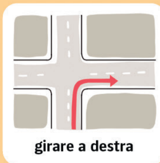
girare a destra