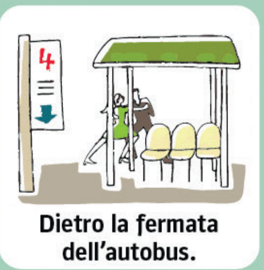
Dietro la fermata dell'autobus.