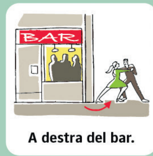
A destra del bar.