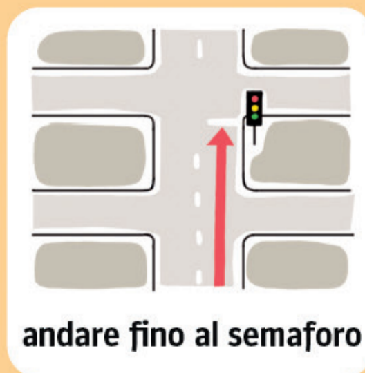
andare fino al semaforo