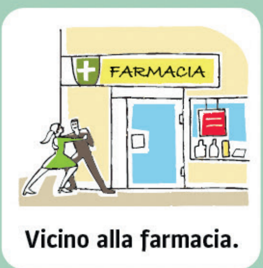
Vicino alla farmacia.