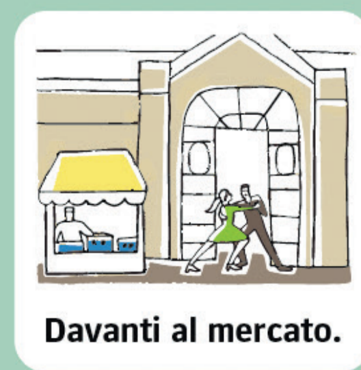
Davanti al mercato.