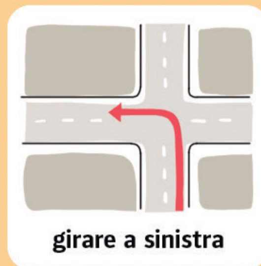
girare a sinistra