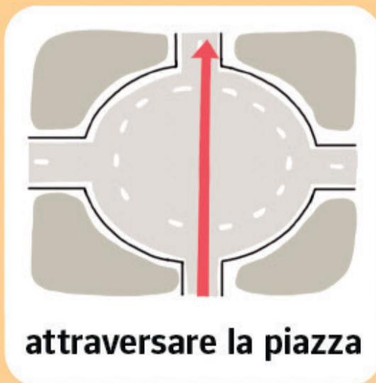
attraversare la piazza