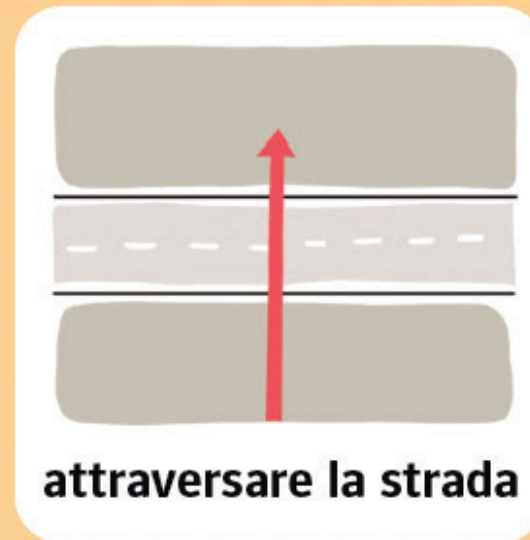
attraversare la strada