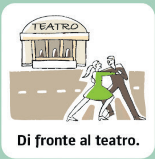
Di fronte al teatro.