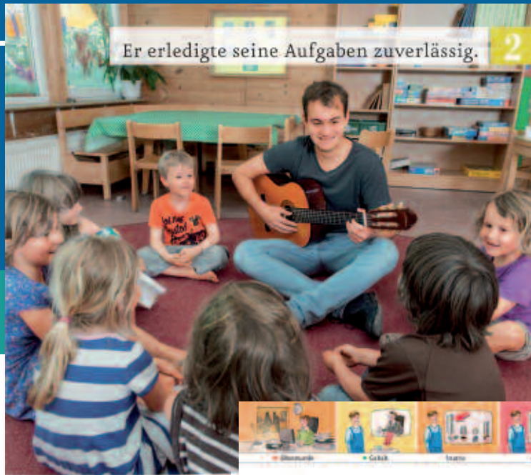
Er erledigte seine Aufgaben zuverlässig.

In jeder Lektion weckt eine kleine Geschichte bei den Lernenden Emotionen und das Interesse an den Lerninhalten.