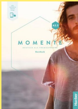
Cover: © Hueber Verlag, München