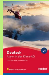
Cover: © Hueber Verlag, München