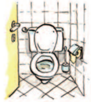
die Toilette/ das WC