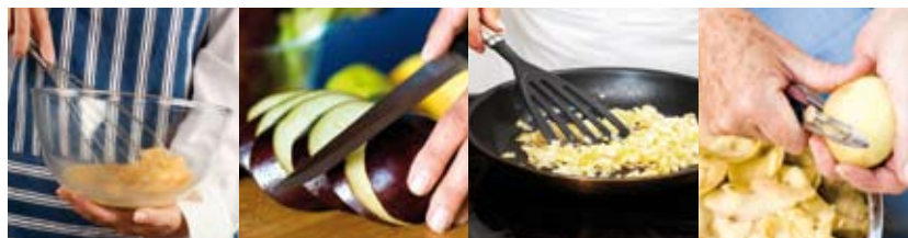
Batir Cortar Freír Pelar

b Observa las imágenes y después completa la receta de las berenjenas rebozadas.