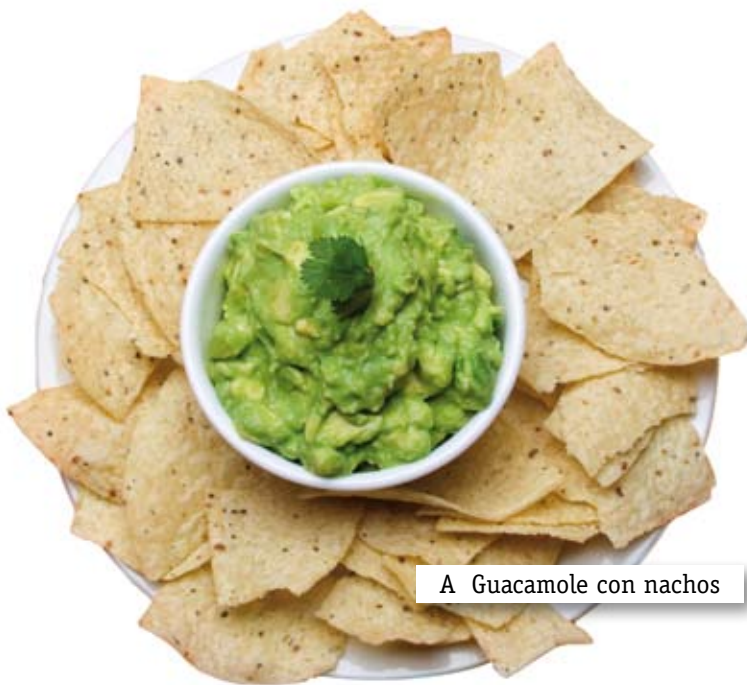
A Guacamole con nachos