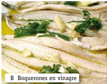
B Boquerones en vinagre