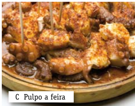
C Pulpo a feira

b Subraya en las frases anteriores los pronombres de objeto directo. Después, completa el esquema con sus formas.