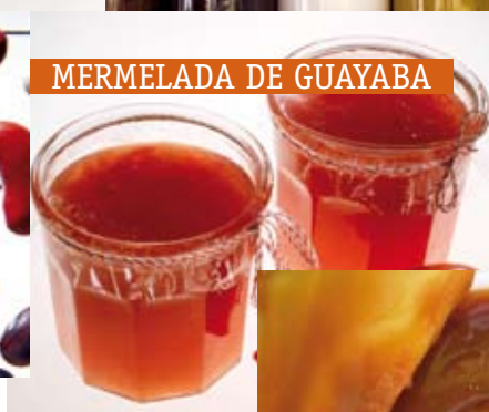
MERMELADA DE GUAYABA