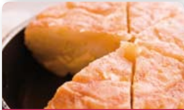
Tortilla de patatas