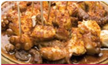
Pulpo a feira

a ¿Conoces estos platos y bebidas? ¿Los has probado alguna vez? Observa las fotos y, en grupos, comentad las características de cada plato.