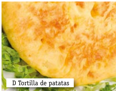
D Tortilla de patatas