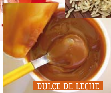
DULCE DE LECHE