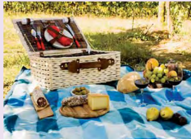
ein Picknick machen