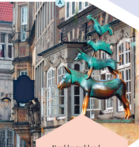
Norddeutschland: Die Bremer Stadtmusikanten in Bremen neben dem Rathaus