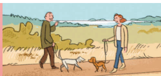
◆ die Bekannte / ◆ der Bekannte