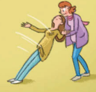
◆ das Vertrauen