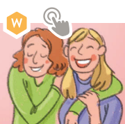
◆ die Freundin / ◆ der Freund

+ SCHON FERTIG? Sprechen Sie über weitere Personen aus Ihrem Baum.