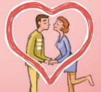
◆ die Liebe