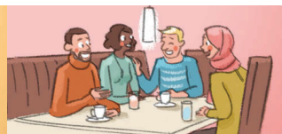
◆ der Freundeskreis