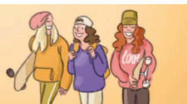
◆ die Clique