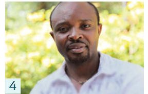
4 Khenty (35)