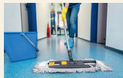
den Boden wischen