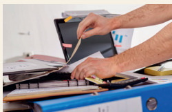
das Büro aufräumen

b Zu zweit: Welche Aufgaben hat Dragan vielleicht? Überlegen Sie.