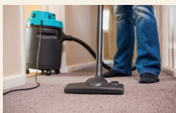
staubsaugen, den Teppich saugen