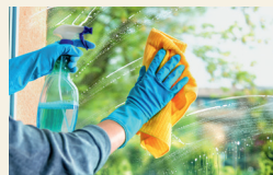
die Fenster putzen