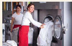
die Wäsche waschen