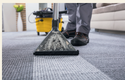
die Teppiche reinigen