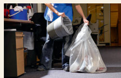
die Mülleimer ausleeren