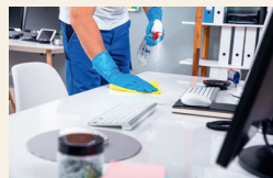
die Tische abwischen