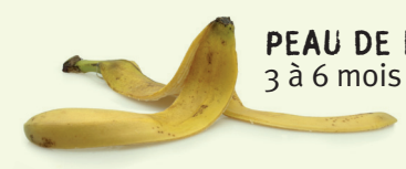
PEAU DE BANANE 3 à 6 mois