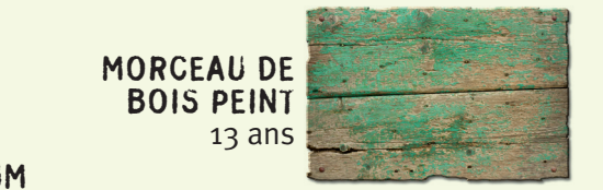
MORCEAU DE BOIS PEINT 13 ans