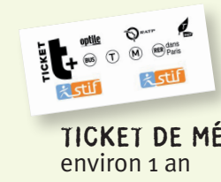
TICKET DE MÉTRO environ 1 an