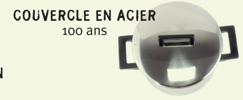
COUVERCLE EN ACIER 100 ans