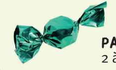
PAPIER DE BONBON 2 à 5 ans