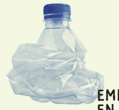
EMBALLAGE EN PLASTIQUE 450 ans