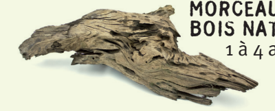
MORCEAU DE BOIS NATUREL 1 à 4 ans