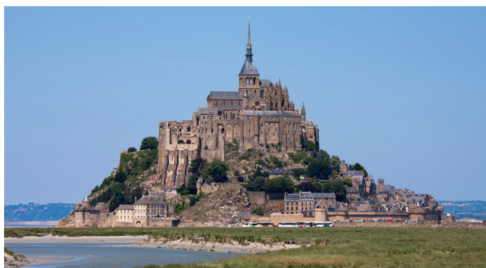
Le mont Saint-Michel, en Basse-Normandie.

Écrivez les mesures que pourrait prendre le gouvernement français pour protéger le mont Saint-Michel.