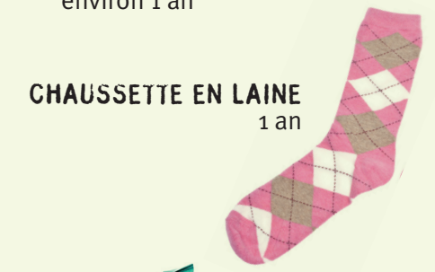
CHAUSSETTE EN LAINE 1 an