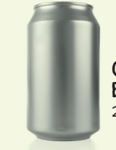
CANETTE EN ALUMINIUM 200 à 400 ans